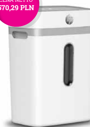
HP OneShred 12CC KOD KAT.: 14K614X