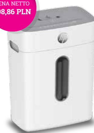
HP OneShred 8CC KOD KAT.: 14K613X