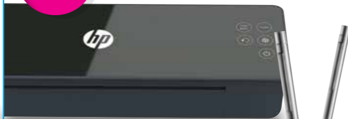
HP Pro Laminator 600 A3 KOD KAT.: 14K611Y