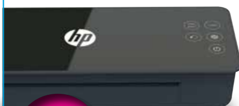
HP Pro Laminator 600 A4 KOD KAT.: 14K611X

PRZY ZAKUPIE WYBRANEGO URZĄDZENIA BIUROWEGO LUB HOME OFFICE MARKI HP